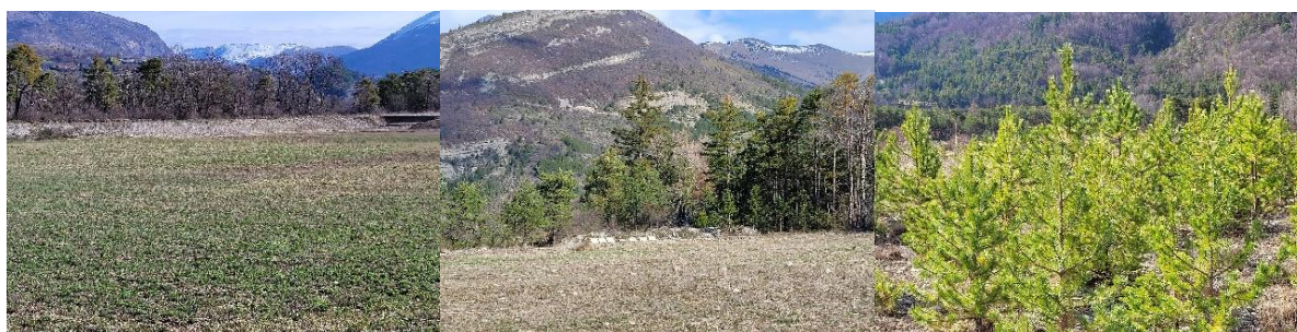
Réaménagement + ruches

➤ -Je me suis rendu sur site et j'ai constaté effectivement ces réaménagements matérialisés par les photos ci-après :